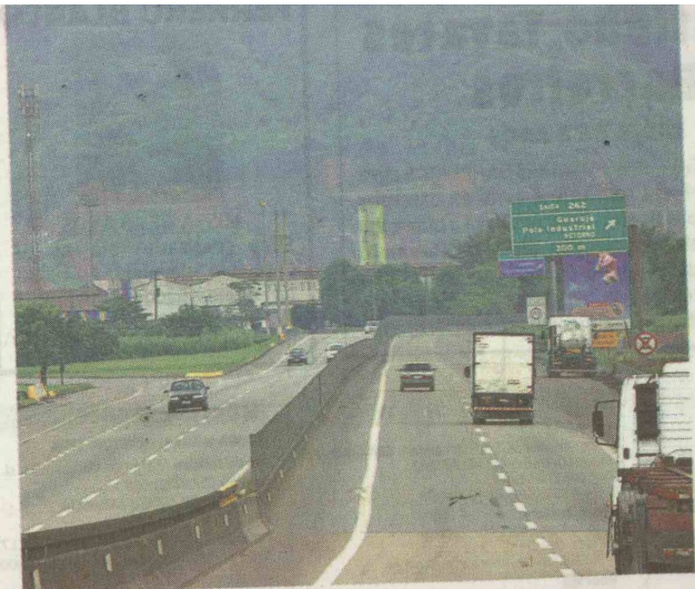
O movimento na balsa e estradas foi tranquilo até o início da tarde